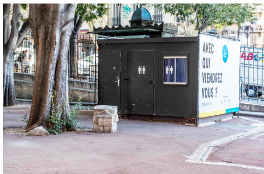
toilettes publiques du théâtre dans la cour