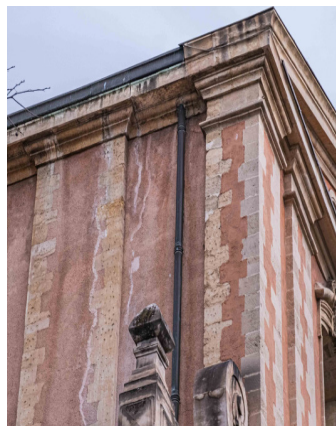
traces de débordement de la gouttière sur l'enduit de façade