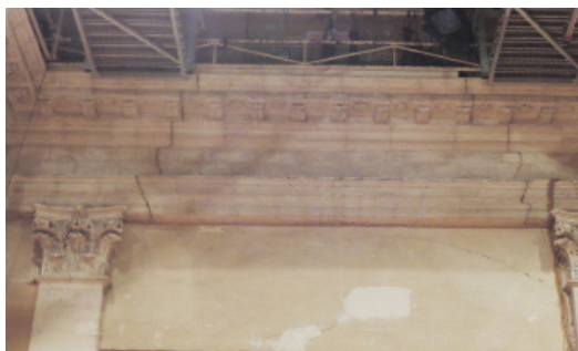
fissures structurales sur les corniches