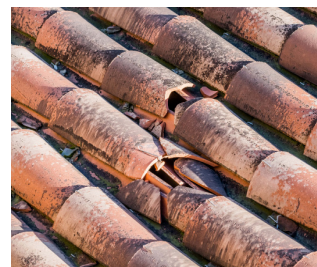
désordres sur les couvertures