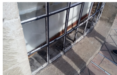
désordres sur les menuiseries