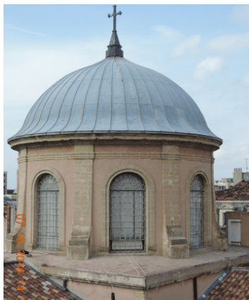
la coupole de la chapelle