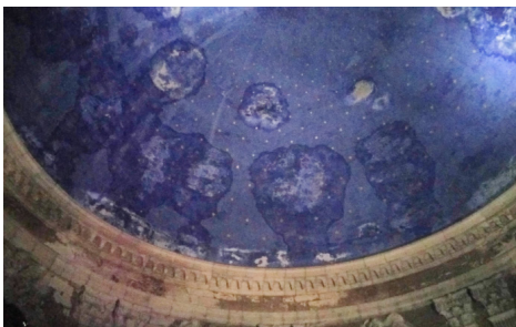
plafond peint de la coupole dégradé