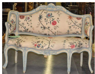
Petit canapé à oreilles garni d'indiennes des collections Borély

diaporama icono sofas projeté dans le fond de l'alcôve