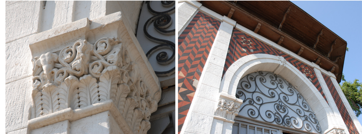
Relevé photographique mars 2011