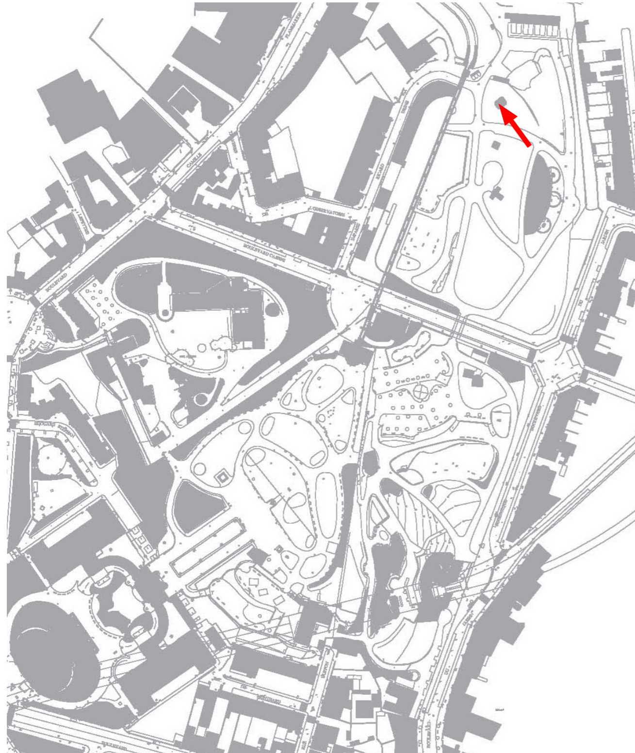
Extrait plan masse palais et parc Longchamp, Marseille.