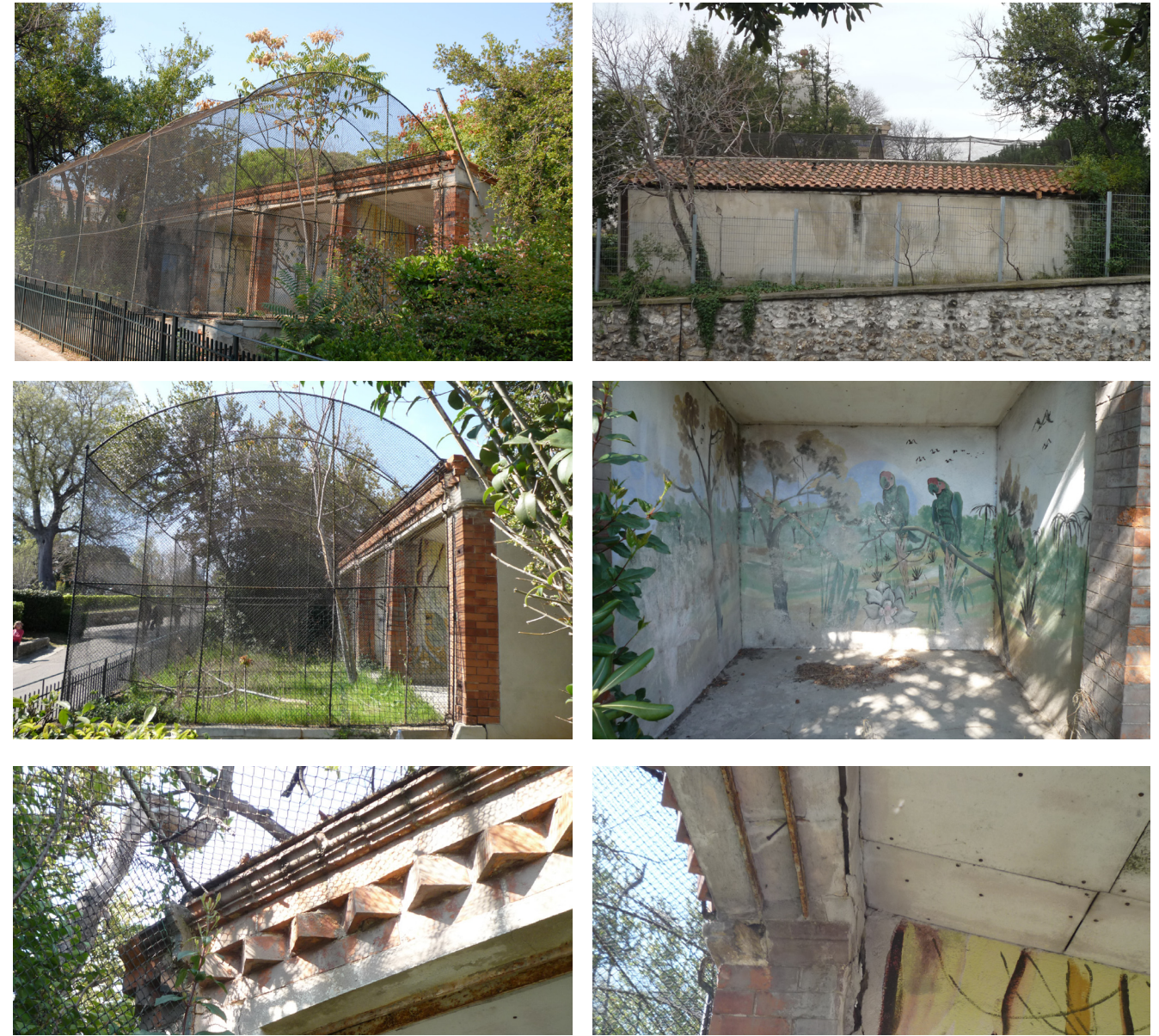
Relevé photographique mars 2011.

Une végétation parasitaire sous forme de rejets se développe aux abords et dans la fabrique.