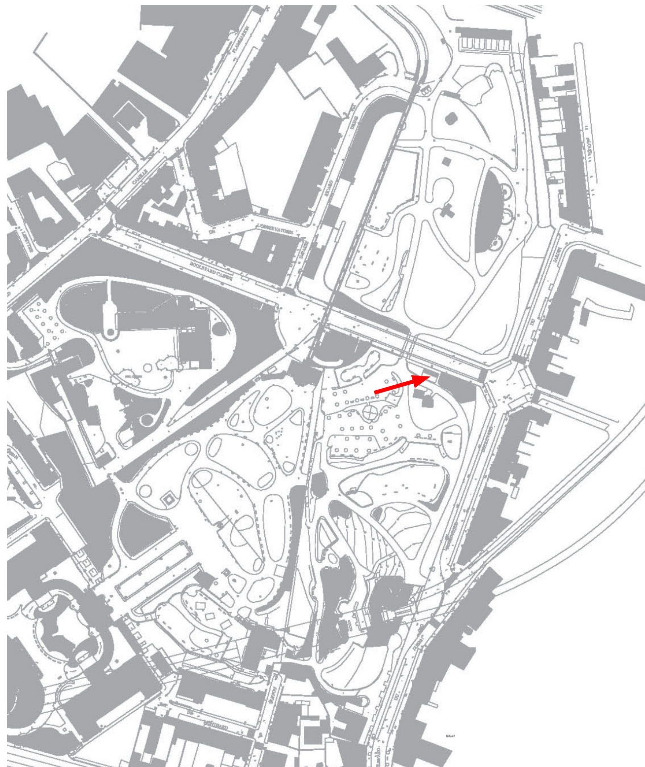
Plan de repérage, extrait plan masse palais et parc Longchamp, Marseille.